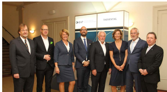
BAP-Thementag Personalvermittlung in Berlin